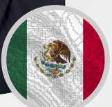
Alonso Bustillos De Cima Socio BGC ABOGADOS